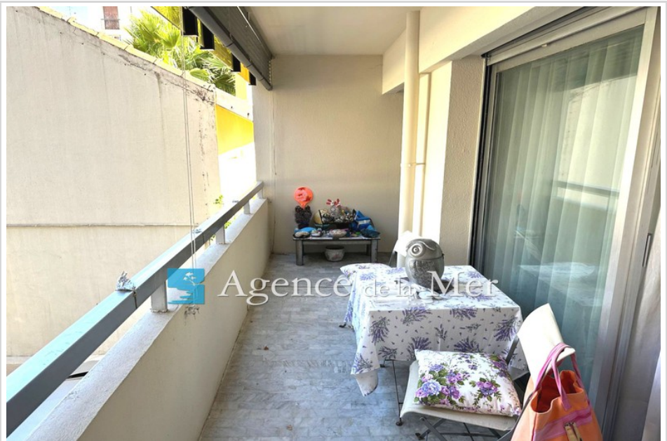
Appartement 5502 Juan-les-Pins

6,21% TTC d'honoraires inclus à la charge de l'acheteur (290 000 € hors honoraires), bien en copropriété(85 lots dans la copropriété), charges courantes annuelles 1 740 € (145 € par mois), aucune procédure en cours, les informations sur les risques auxquels ce bien est exposé sont disponibles sur georisques.gouv.fr